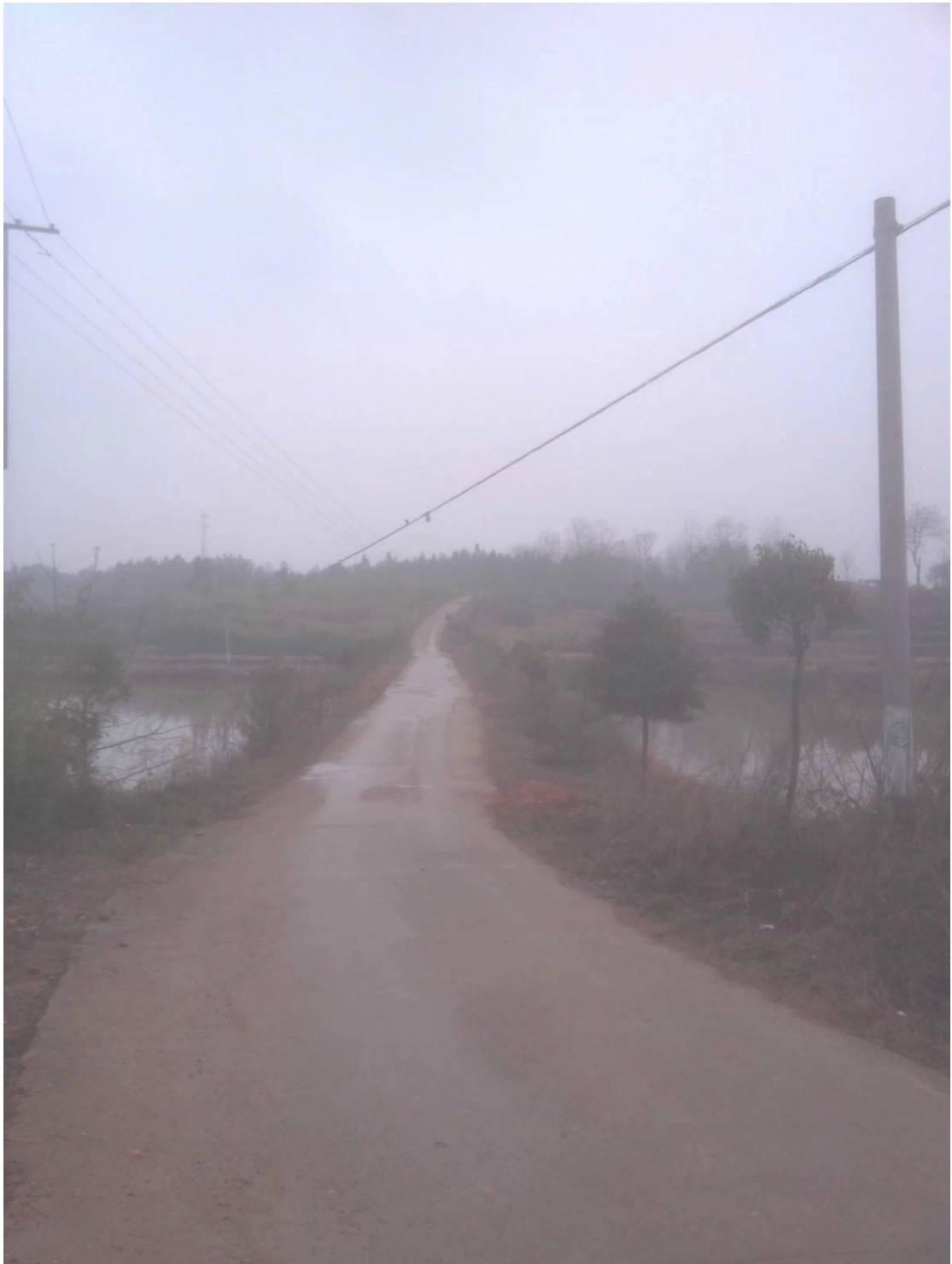
郁郁迟行步，山野凄迷。(手机拍摄，像素不是很高)