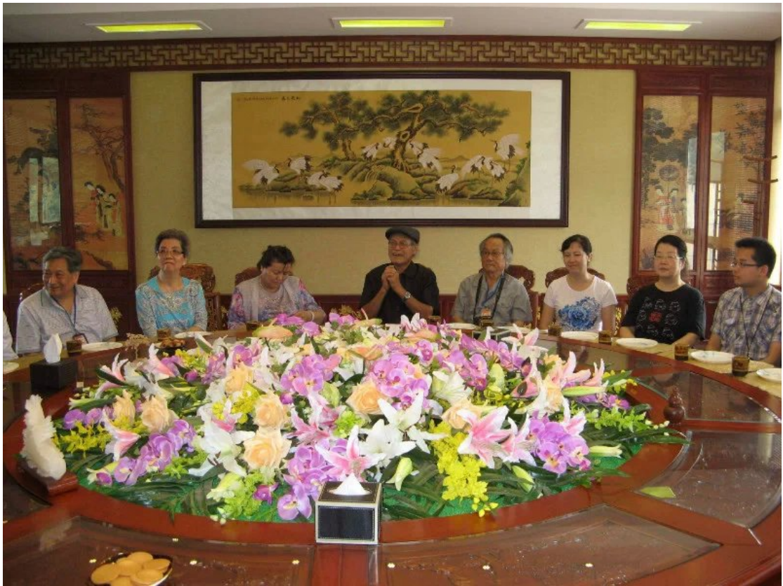
百望山盆景苑聚餐 —— 高朋满座兰亭谊，叙离怀、醉乐持盅。