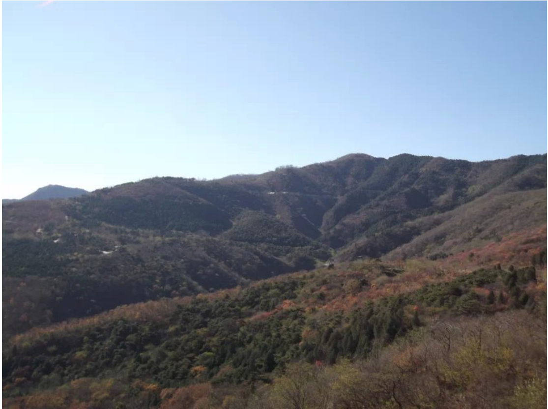
燕麓天高，轻云送雁，西山叠嶂绯红。