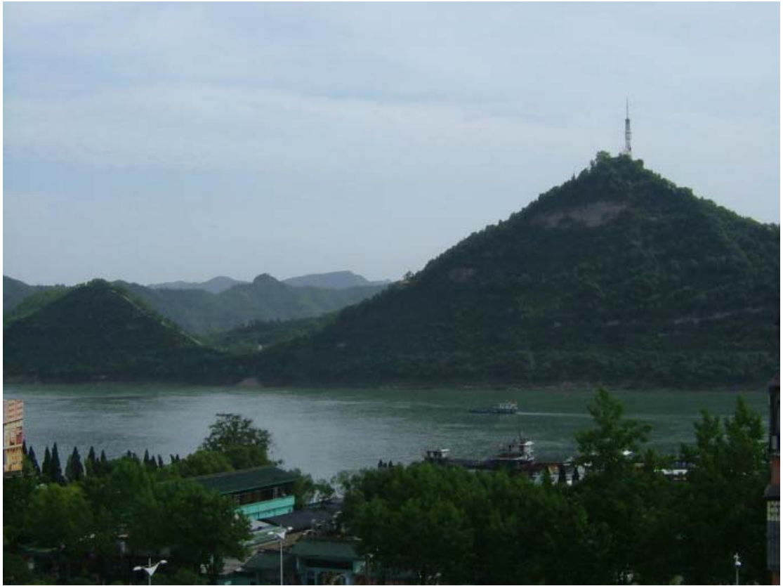
远眺夷陵长江大桥、磨基山