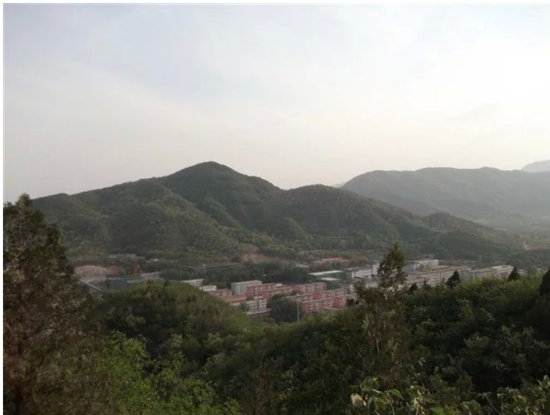
百望山下的韩家川村 --- 作者来京租住之地。