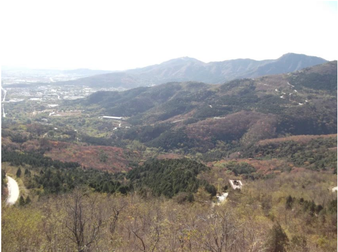
燕麓天高，轻云送雁，西山叠嶂绯红。