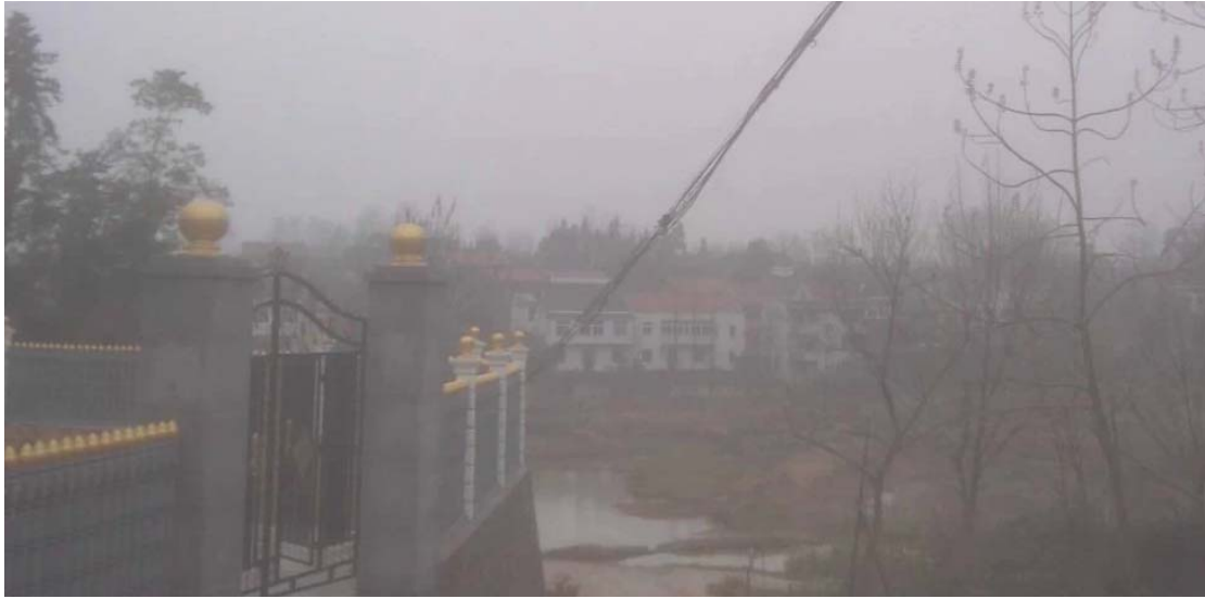
回望青砖黛瓦，烟树绕村溪。(手机拍摄，像素不是很高)