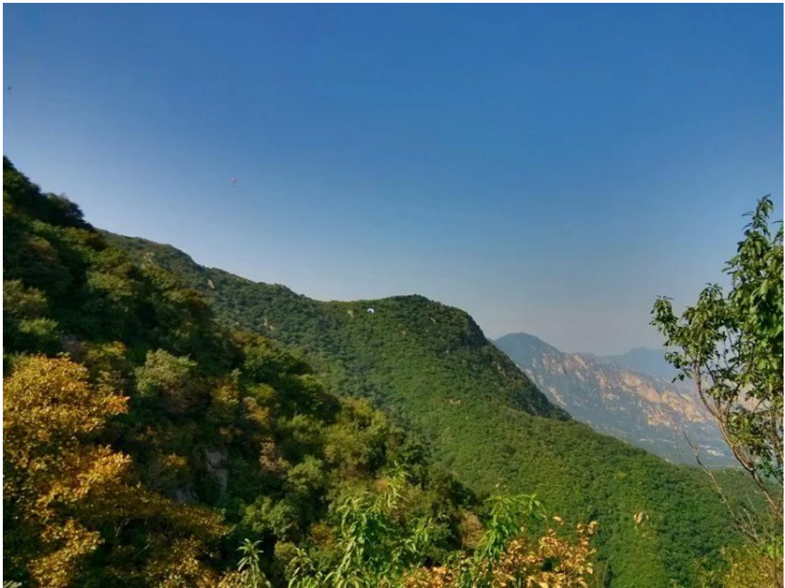
阳台山夏末秋初景色