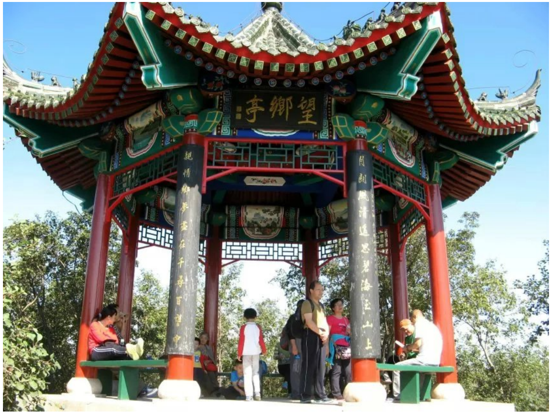
百望山中的望乡亭