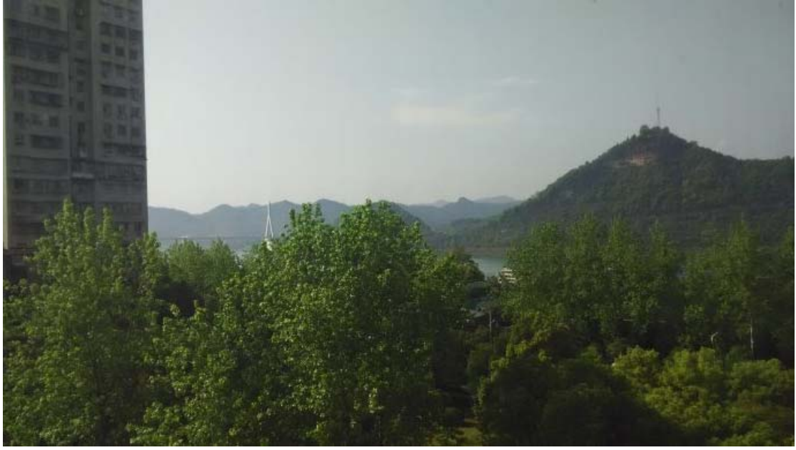
远眺夷陵长江大桥、磨基山