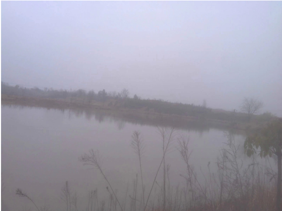
渐潇潇冷雨，风摧瘦柳，浪卷湖堤。(手机拍摄，像素不是很高)