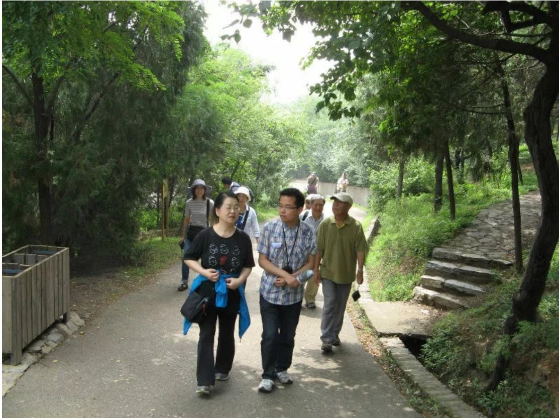
一起去望乡亭的路上