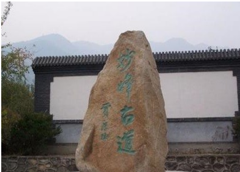
阳台山上的妙峰古道