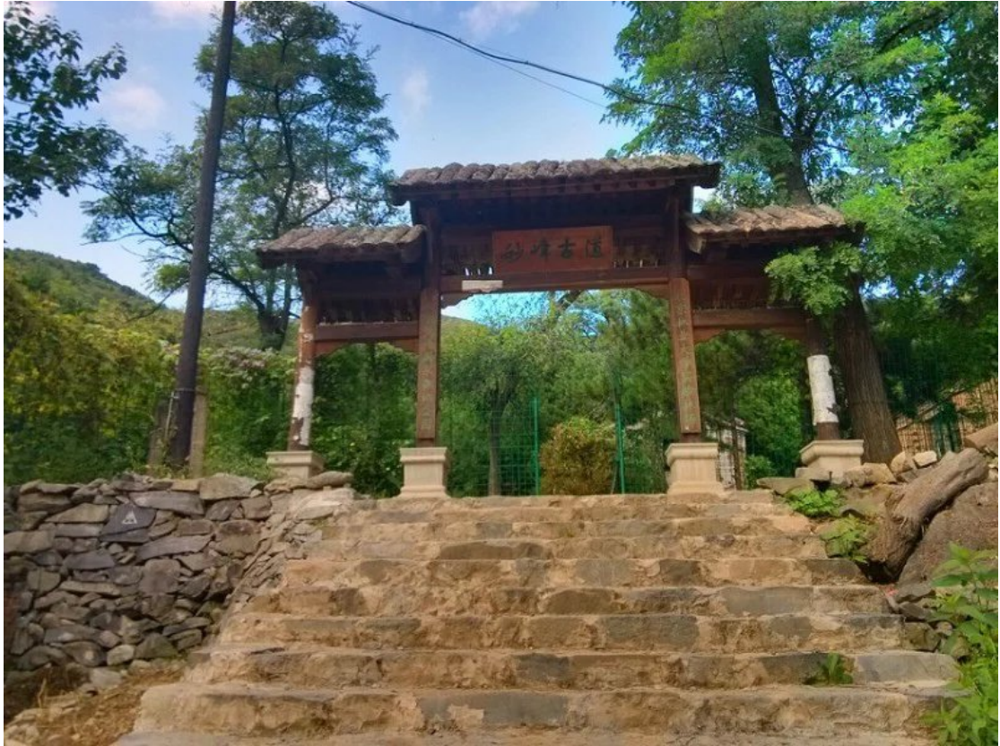
阳台山上的妙峰古道